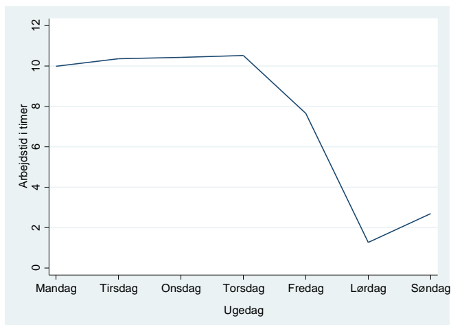
Figur 3.1 Gennemsnitlig arbejdstid i timer fordelt på ugedage i den registrerede uge (kommunale topledere)

Som det fremgår af figur 3.1, er arbejdstiden stabilt høj mandag til torsdag med omkring 10 timer pr. dag. Fredag er en "kort" dag med lidt under 8 timers arbejde. Endelig bliver der i gennemsnit udført omkring 4 timers arbejde i løbet af weekenden, særligt om søndagen. Over 90 % af de kommunale topledere udførte arbejde i weekenden i den registrerede uge.